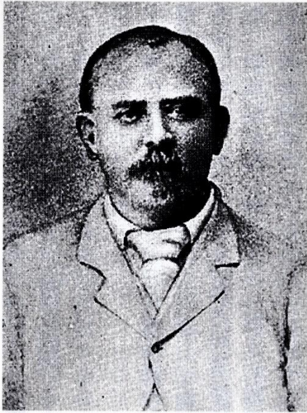
L.L. ジェーンズ