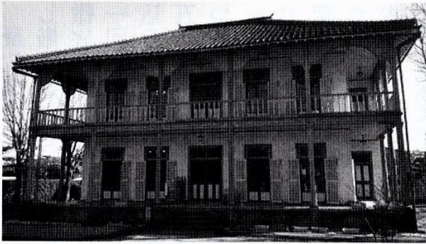
熊本地震前のジェーンズ邸 (水前寺公園：Wikipediaより)

教の事に関して」によると、ジェーンズは熊本洋学校の教師としてキリスト教について少しも口にしなかつたという。