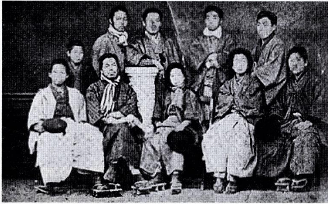
熊本洋学校の生徒たち (1875年)

物であろうか、何者か之を主宰する者があるのではなからうかと云ふ如き質問を起し、天地の神秘を以て有神の信仰の自然なる事を語り、又或時は歴史や英文学を教ゆるに当り、欧米文明の基礎は基督教の信念にある事を述べて聖書を理解するの必要を示し、若し有志の生徒にて聖書を学ばんと欲する者あらば一週に一夜自宅にて之を教へてもよいと勧誘した。其結果毎水曜日の夜三四十名の生徒は彼の宅に集り聖書を学ぶ事となつた」